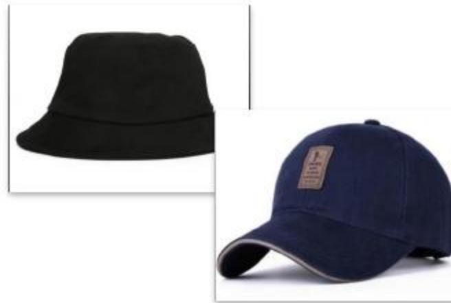
Chapéu, boné e similares