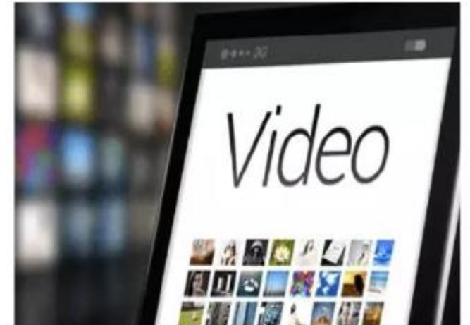
Aplicativos e filtros de edição